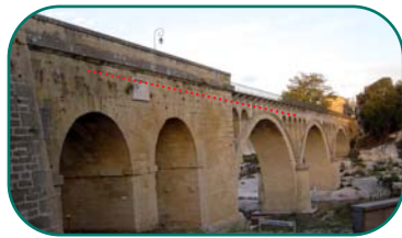
Le Gardon à Collias

Les années 1907 et 1958 ont été particulièrement difficiles : elles ont connues 2 crues majeures dans la même année.