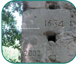
L'Alzon à Uzès

La crue la plus ancienne connue au travers d'un repère est celle de l'Alzon de 1634 dans la vallée de l'Eure à proximité d'Uzès. Anduze présente un site remarquable avec pas moins de 9 repères de crue couvrant une période de 1861 jusqu'à 2002.