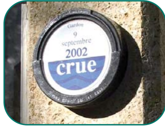
Nouveau pictogramme officiel

Dans le but de formaliser cette démarche, un pictogramme officiel a été défini au niveau national. Ainsi, sur l'ensemble du territoire, vous repèrerez aisément ces macarons.