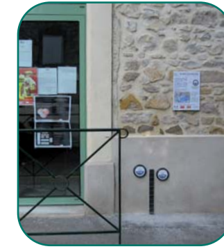
Mairie de Ners

Les gens et parfois les mairies ont posé des repères de crue. Soumis au ravalement de façade ou à l'usure du temps, les repères disparaissent progressivement. Pour éviter la disparition régulière de notre mémoire collective, les communes ont obligation* de poser les repères de crue et de les