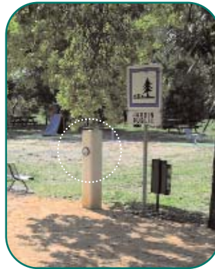
Jardin public à Saint Hilaire de Brethmas