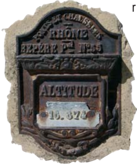
Ancien repère de crue à Aramon

Les repères de crue sont des marques réalisées par l'homme pour matérialiser le niveau atteint par une crue. Ces marques peuvent prendre plusieurs formes : inscription à la peinture, gravure d'un mur de pierre, plaque, pièce de fonte... Elles contiennent des informations diverses : parfois, il n'existe qu'un trait, souvent, il est fait mention de la date de la crue, plus rarement, le nom du cours d'eau est inscrit.