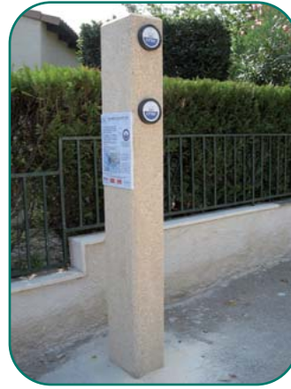
Totem à Montfrin

Le SMAGE des Gardons a recensé 42 sites d'anciens repères de crues. Le syndicat a posé, sur l'ensemble du bassin versant, en 2006, près de 200 repères répartis sur une centaine de sites. Ils sont posés soit directement sur des bâtiments, soit sur des totems en pierre ou en bois.