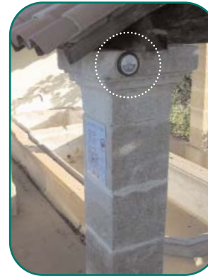
Lavoir à St Mamert

Opération conduite avec nos partenaires financiers :